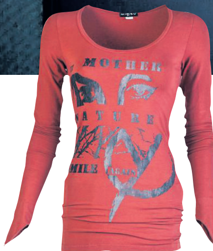
■ Top en broek van MIYSU