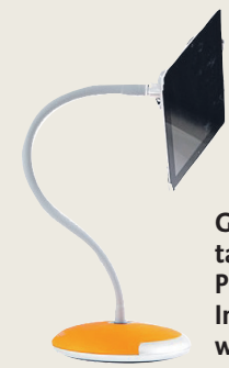
Goos-e flexibele tablethouder Prijs: 89 euro Informatie: www.goos-e.com